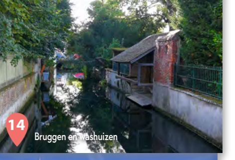
14 Bruggen en washuizen