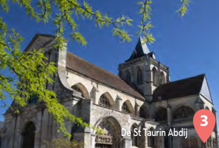
3 De St Taurin Abdij