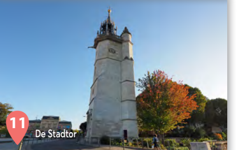
11 De Stador