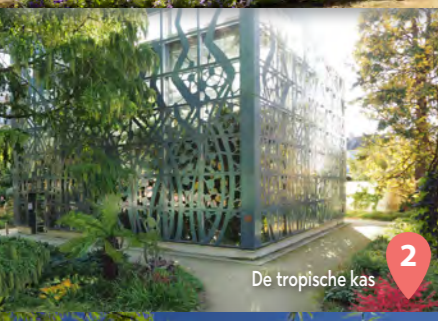
2 De tropische kas