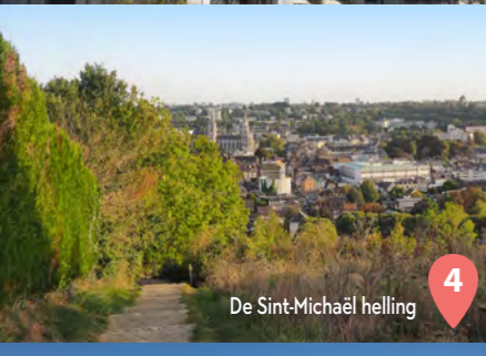
4 De Sint-Michaël helling