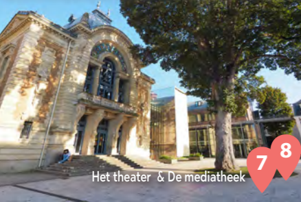
7 Het theater & De mediatheek