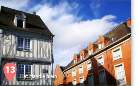
13 Het Mandje plein