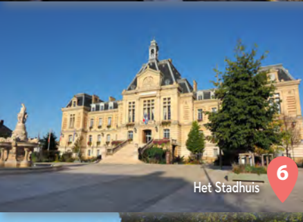
6 Het Stadhuis