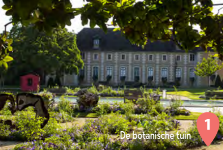
1 De botanische tuin