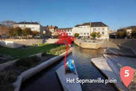
5 Het Sepmanville plein