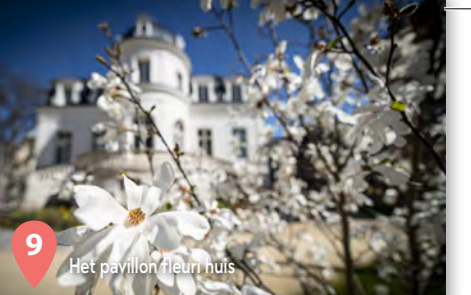
9 Het pavillon fleur nuis