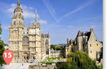
15 Het bisschoppelijk stadsdeel